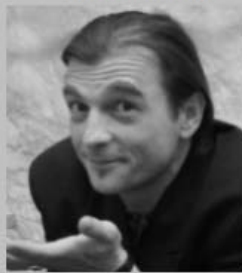
Regie Damir Žižek