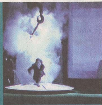
Odysseus Akte – 2003