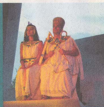
Hamlet – 2002