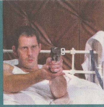
Der stumme Diener – 2006