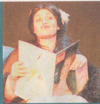
Strindberg – 2004